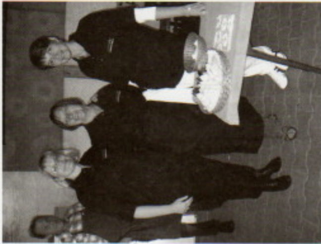
oben: das Grill- und Zapf-Team; unten: im Festzelt