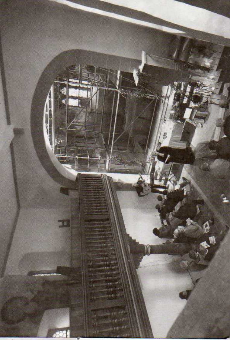
Diagonale Durchblicke auf Baustellen-Predigt (oben) und Bildershow (links unten) – gut gesehen vom Fotografen André Hirtz.