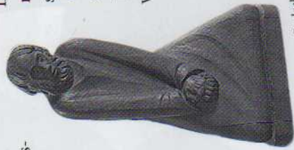
Der Zweifelnde (Ernst Barlach)